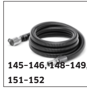
145-146, 148-149, 151-152