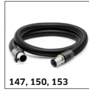
147, 150, 153