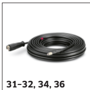
31-32, 34, 36