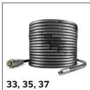
33, 35, 37