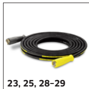
23, 25, 28-29